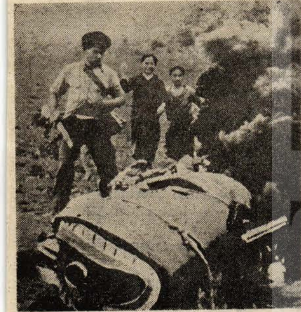
Devrimci savaş, halk yığınlarının savaşidir. Resimde, Hindistan'da halk milislerinin tüfekle düştüğü bir ABD uçağı.

Reformcular, kapitalist düzende ve burjuva dev-